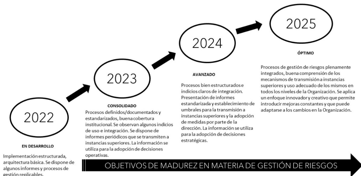
Figura 2. Niveles de madurez del riesgo