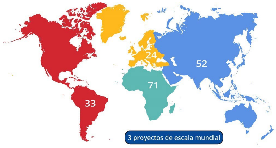
Gráfico 1. Número de proyectos en los que se integró el Marco de Resultados Estratégicos, por región (2022-2024)

11. Los recursos del proyecto del Comité de Asignación de Recursos para Actividades sobre Migración se utilizaron para llevar a cabo, por conducto del Fondo de la OIM para el Desarrollo, iniciativas específicas de desarrollo de capacidades destinadas al personal de las oficinas regionales y en países. En ellas se proporcionaron herramientas y orientaciones para que estas personas integraran el Marco de Resultados Estratégicos en sus respectivos proyectos del Fondo. Entre los principales logros conexos cabe mencionar la integración del Marco de Resultados Estratégicos en los 183 proyectos del Fondo de la OIM para el Desarrollo creados durante el periodo abarcado por la prueba piloto, a saber, de 2022 a 2024 (véase a título de ejemplo el gráfico 2, relativo a 2023), así como la provisión de apoyo adaptado en materia de fortalecimiento de capacidades a 519 miembros del personal de la OIM en un total de 89 oficinas de todas las regiones del mundo.