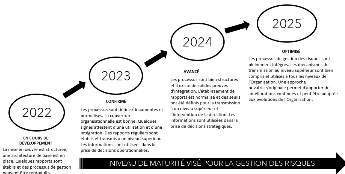
Figure 2. Niveaux de maturité en matière de risques